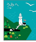
「うみへ やまへ」 三浦 太郎 作 偕成社

いつもは森であそんでいるこぐまたち。今日はバスに乗ってお出かけです。こぐまたちの目の前に広がるのは…。海へのお出かけ前に、親子で読んでみてください。