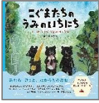
「こぐまたちのうみのいちにち」 サクマ ユウコ 作 つむぐ社

夏には「海の日」も「山の日」もやってきます。そこで海・山をテーマにした絵本を集めました。暑すぎる日には絵本の中で、海や山へのお出かけ気分を楽しんでみてください。