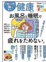
「健康 2026 夏」 主婦の友社