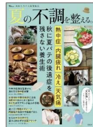
「夏の不調を整える。」 宝島社