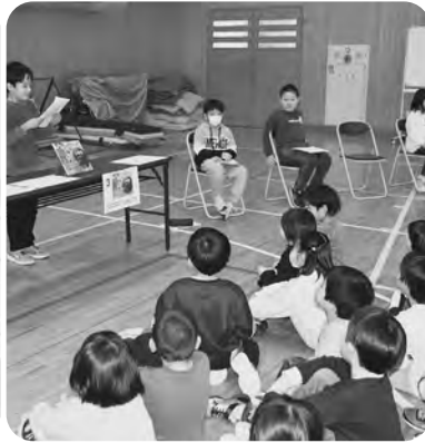
▲1・2年生のビブリオバトル