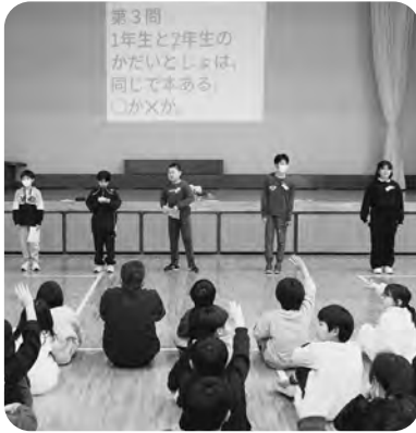
▲図書委員によるクイズ！

12月16日に図書集会を行いました。その中で、3年生以上の参加希望者によるビブリオバトルを行いました。参加者がそれぞれの本を紹介した後、発表を聞いた人の多数決で「チャンプ本」を決めました。どの本にもそれぞれの魅力があり、「読んでみたい！」と話していました。