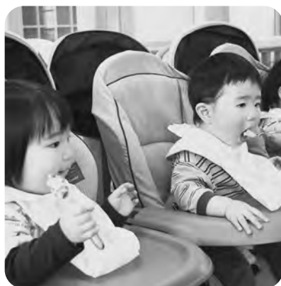
▲1月7日、七草ビビンバを味わう0歳児

笑顔があふれ、歓声がこだまする 保育園をめざし、今年も一生懸命努 めて参ります。ご支援よろしくお願 いいたします。