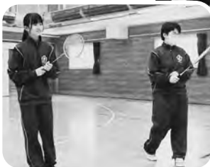
▲バドミントン競技（ダブルス）