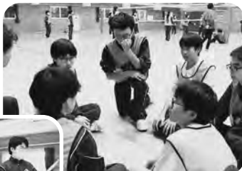
▲バレー種目（全校縦割りチーム）

12月16日、寒さを忘れさせるほどの熱気と笑顔に包まれた球技大会が開催されました。バレーボールでは学年を超えた結束力でボールを繋ぐ姿が輝いていました。バドミントンでは、パートナーと微笑みを交わしながら、一打ごとに心地よい交流を楽しむ姿が見られました。寒さの中でも互いを思いやる心で会場は満たされ、冬の貴重な思い出を刻む一日となりました。