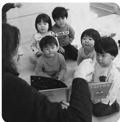
▲英語の絵本に興味を示す1・2歳児