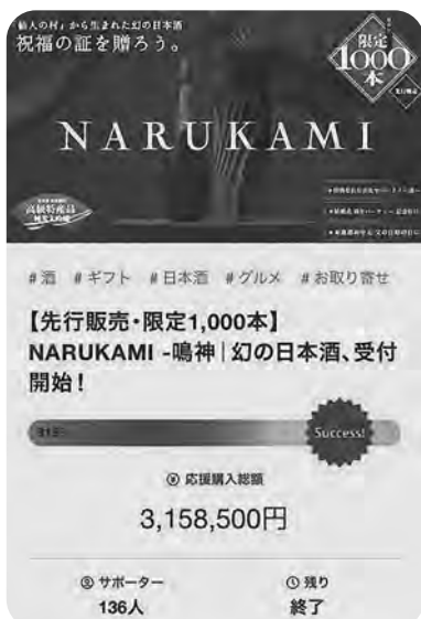
▲クラウドファンディングを2か月間実施。のべ136人の皆さまからご支援をいただきました。