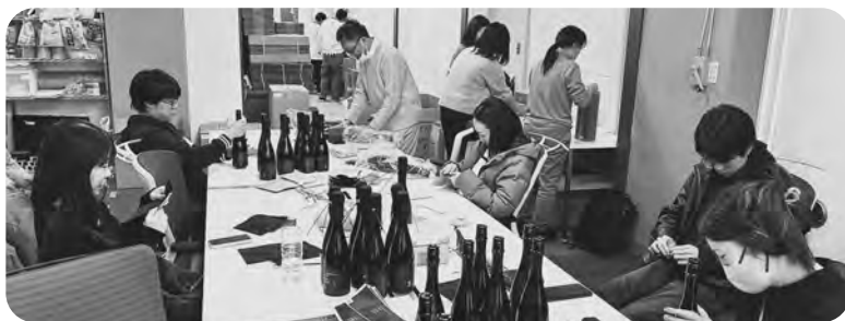
▲発送作業の様子 なるテック社員で感謝と真心をこめて包装・発送いたしました。

これからも「鳴神」が、日本中の祝い事や感謝を伝える場面で選ばれ、東成瀬村を代表する特産品と呼んでいただけるよう、責任をもって事業に取り組んでまいります。