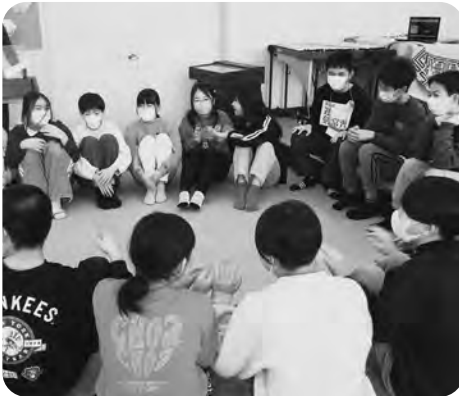
▲どんなふうに歌えばいいかな？

3・4年生は外国語活動で、5・6年生は道徳と音楽で、増田小学校と合同学習を行いました。英語で互いに自己紹介やゲームをしたり、歌い方についてアイデアを出し合ったりして合唱をしたりしました。なるせつ子たちは、たくさんの同学年の友達と一緒に学習を楽しんでいました。