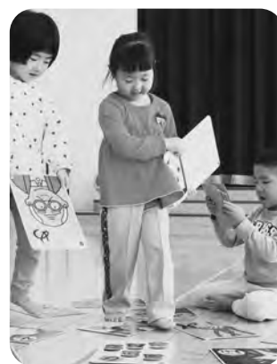
▲迫力満点！大型かるた