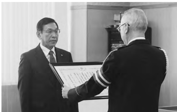
▲高橋横手警察署長から表彰を受ける村長

祝辞で、雄勝地域振興局長は「この数年間、ダム工事の関係から交通量が多い中で、3500日達成は素晴らしいことです。これからも継続してほしい」横手警察署長は「引き続き、交通死亡事故ゼロを継続し、4000日そして5000日と継続をしてほしい。県内での最長記録は藤里町の6532日なので、それを超えるように期待している」と述べました。 村の交通死亡事故抑止継続の最長記録は3595日(平成5年8月24日から平成15年6月27日まで)です。この記録を超えることができるよう、一人ひとりが注意し、交通死亡事故ゼロを継続しましょう。