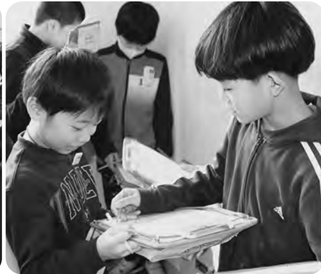
▲英語でビンゴに挑戦！