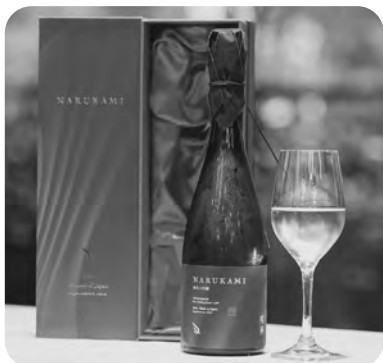
▲昨年9月にリリースした「鳴神-NARUKAMI」