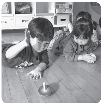
▲縁起物のコマ回しを楽しむ2歳児