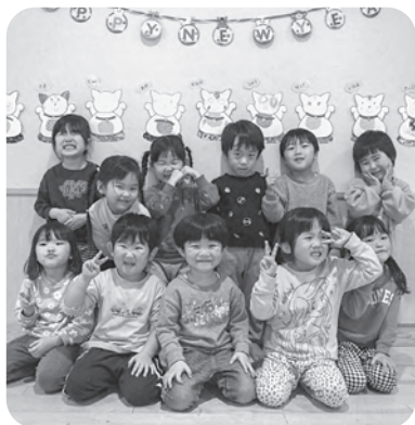
▲壁面に福を呼ぶ招き猫を飾った3歳児

笑顔があふれ、歓声がこだまする保育園をめざし、今年も一生懸命努めて参ります。ご支援よろしくお願ひいたします。