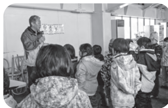
▲聞くことの大切さ

1月9・10日、村内小中学生を対象とした「虎の穴スキー教室」が実施されました。時折晴れ間ものぞきましたが、しんしんと降る雪の中、最後まで元気に滑りました。東成瀬スキークラブ指導者の方々のきめ細かく丁寧で熱心な指導の下、子ども達はスキーの楽しさを心から感じながら上達した二日間だったと思います。スキーは回数を重ねるほど上達しますので、シーズン中は1回でも多く、村の素晴らしいホームグレンデ「ジュネス栗駒スキー場」に足を運びましょう。