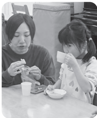
▲パイ菓子を試食中

1月10日、多数の保護者の皆様にご参加いただき「クラス懇談会」「子育てセミナー」「おやつ試食会」が開催されました。共通の話題で意見を交わし理解を深め合うことで、保育者と保護者間の信頼感や連帯感につながる機会となりました。