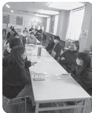
▲4歳児クラス懇談会