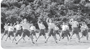
▲よさこいパフォーマンス