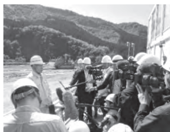
視察後の記者会見