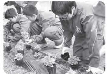
▲今年中は庭に植栽しました