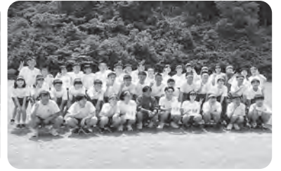
▲やりきった！ 記念撮影