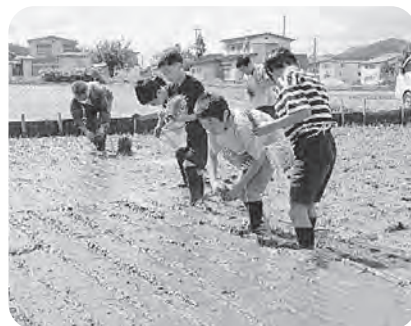
▲だんだん上手になってきた