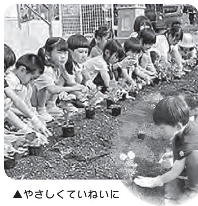
▲やさしくていねいに