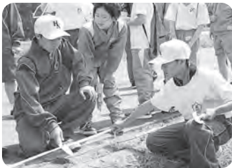
▲小学生と協働作業