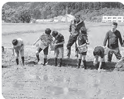
▲いざ、田んぼの中へ！

5月29日、5年生が田植え体験を しました。JAの方々から植え方を 教えていただいた後、いよいよ田ん ぼの中へ。最初は慣れない土の感触 に戸惑っていたようですが、だん だん上手に植えることができるよう になりました。今後は、苗の成長を 見守っていきます。