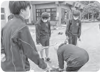
▲植えた後は水をやり

それぞれ様々な目的で行われている活動ですが、たくさん綺麗な花が咲き、見る人の心を和ませてくれると良いですね。