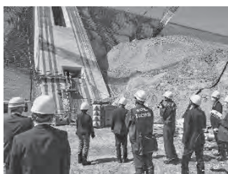
現場での工事状況確認