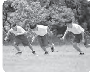
▲全員リレー スタート！