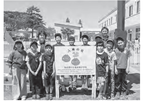
小学生(人権の花植え)