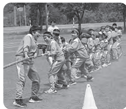
▲チームの力を一つに

組が心を一つにしてがんばり、大 いに盛り上がりました。 高学年の子どもたちは各係の仕 事も行い、運動会を支えてくれま した。一生懸命がんばる子どもた ちの姿に、保護者の皆様からたく さんのあたたかい声援をいただき ました。どうも、ありがとうございました。