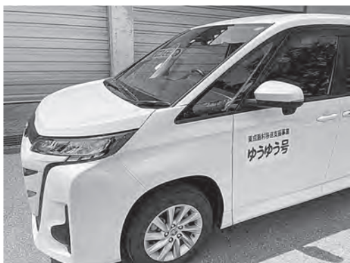
▲移送支援事業【ゆうゆう号】

既に応募があった村民ボランティア17名の協力を得て、利用者19名の希望日に合わせ専用のワゴン車でほぼ毎日運行しています。