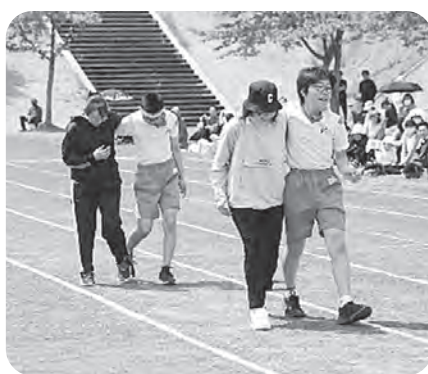
▲息がぴったりですね

組が心を一つにしてがんばり、大 いに盛り上がりました。 高学年の子どもたちは各係の仕 事も行い、運動会を支えてくれま した。一生懸命がんばる子どもた ちの姿に、保護者の皆様からたく さんのあたたかい声援をいただき ました。どうも、ありがとうございました。