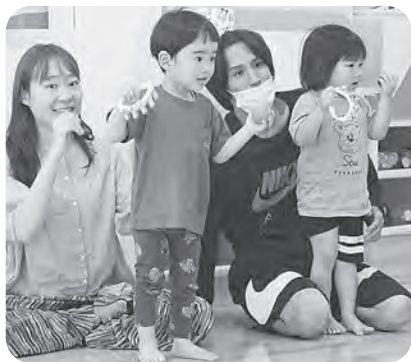
▲リズム遊びを楽しむ2歳児