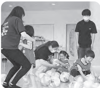
▲ボール遊びで汗を流す4歳児

5月24日、保育参観を行い親子でボール遊びやリズム遊び等を楽しみました。仲良し親子のキラキラな笑顔で、会場は大盛況でした。