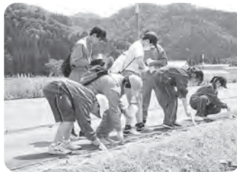
▲国道沿いにキバナコスモス