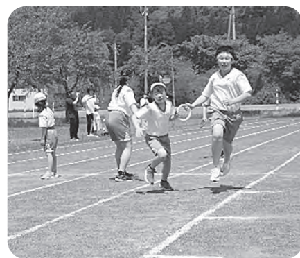
▲色別対抗全員リレー

5月29日、5年生が田植え体験を しました。JAの方々から植え方を 教えていただいた後、いよいよ田ん ぼの中へ。最初は慣れない土の感触 に戸惑っていたようですが、だん だん上手に植えることができるよう になりました。今後は、苗の成長を 見守っていきます。