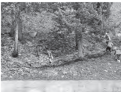
▲消防防災【原野火災発生時】

4月4日に岩井川地区で、同月29日には天江地区で原野火災が発生しました。いずれも、たき火が原因とみられるもので広域消防及び消防団が消火に当たり、延焼も最小限に止めました。今後、より一層の火災予防に向け呼びかけていきます。