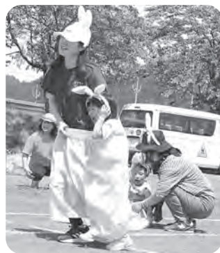
▲6月8日「なるせっ子運動会」