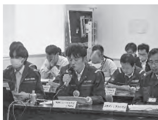
事務局からの説明状況

設事業の進捗状況や工程、コスト縮減策の実施状況について、学識者等に意見を問う「成瀬ダム建設事業マネジメント委員会」を5月10日に開催。基本計画変更（工期及び事業費の変更）案とその内容を示し、内容の妥当性について審議いただきました。