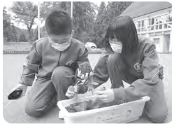
▲人権の花をプランターに