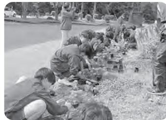
▲綺麗な花が迎えてくれます