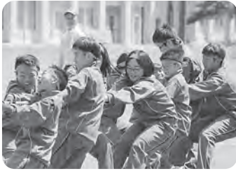
▲網取りの最後の1本