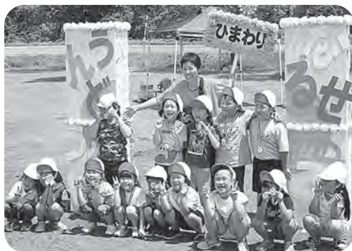
▲頑張った皆さんに金メダル

運動会活動を通して、チャレンジする心、あきらめない力、協力する力等を育んできました。本番では、子ども達の成長を保護者の皆様と一緒に共有する機会となり、嬉しく感じています。運動会での頑張りが自信となっており、ますます大きく成長してくれることを願っています。