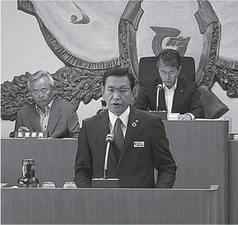
▲行政報告をする村長

6月3日から6月19日までの日程で、令和6年村議会6月定例会議が開催されました。