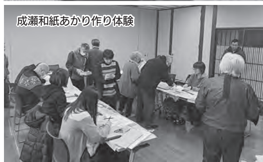
成瀬和紙あかり作り体験