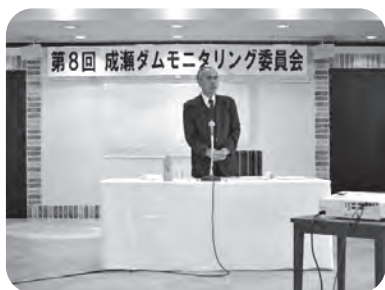
▶委員長のあいさつ