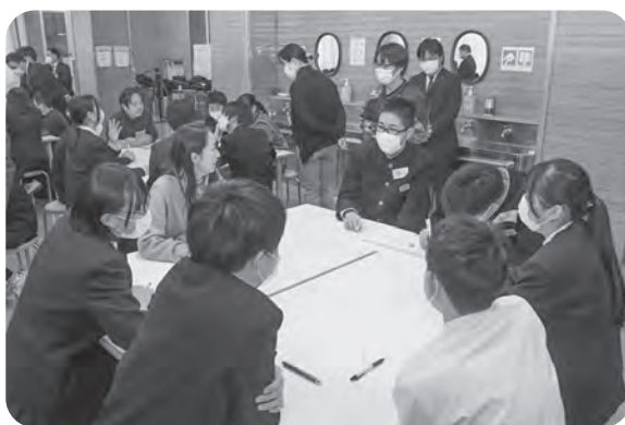
▲1月24日中学校で行われたワークショップ

国交省人材育成事業の講義とワークショップの運営に携わらせていただきました。この活動を通して村でも拠点整備や暮らしやすい村が実現できるかもと興味を持っていただけた方が増えたように思います。まだ構想段階ではありますが、近隣の事業者様にヒアリングを行い、ご協力いただきながら少しずつ実証実験を進める予定です。 東成瀬村がずっと住み続けたい魅力的な村であるためになるテックが一翼を担いたいと考えています。