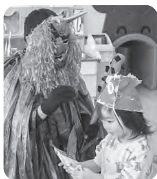
▲お菓子をもらってにっこり!

2月2日に豆まきをしました。鬼が現れると、年長さんを中心に豆に見立てた紙ボールの嵐を鬼に浴びせ、見事退治しました。自分の中の悪い鬼を追い出して福を招き入れたことで、今年一年間の無病息災を願う行事が無事終了しました。