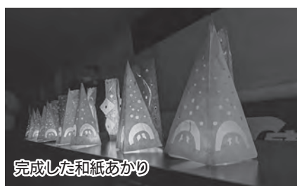
完成した和紙あかり