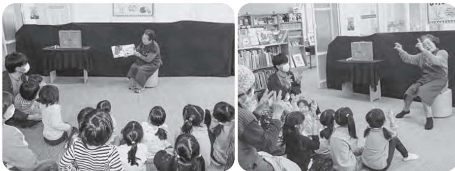
▲「おふくさんのおふくわけ」