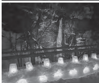
▲不動滝ライトアップ