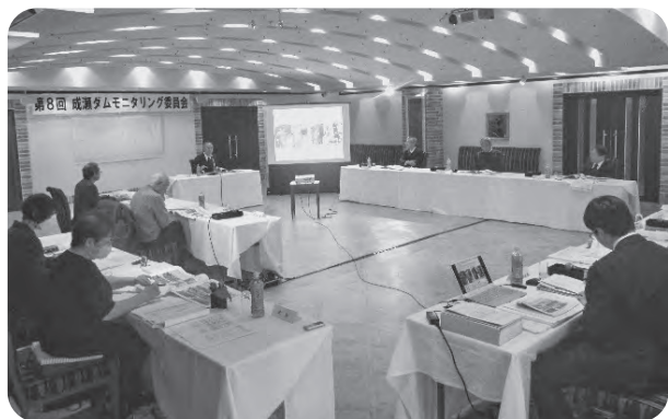
▲成瀬ダムモニタリング委員会の実施状況

この度2月2日に秋田市内で当委員 会を開催し、「令和5年度のモニタリ ング調査結果報告」と「令和6年度の モニタリング調査計画」について報告 しました。