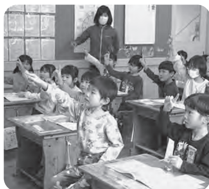
▲国語の授業で漢字の書き方を体験

2月6日、5歳児が小学校を訪問し、1年生の教室で授業の雰囲気味わったり、体育館でリレーや鬼ごっこをして交流しました。これは保小連携推進事業の一環で、保育園と小学校との円滑な接続を図ることをねらいとしています。園に戻ると「楽しかった」という声が多く聞かれ、就学への期待を膨らませています。