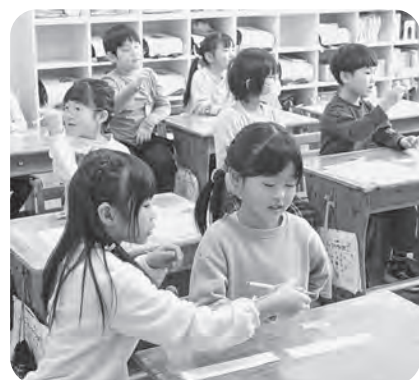
▲先輩から鉛筆の正しい持ち方を伝授