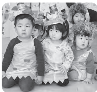
▲可愛い鬼に変身した0・1歳児