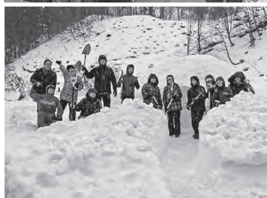
▲スノーシュー・かまくら体験