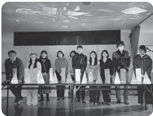
▲成瀬和紙あかり作り体験

東成瀬村観光物産協会が主催する「冬の仙人修行」のモニターツアーにおける企画運営とプロモーションに協力させていただきました。 村の自然環境、文化や特徴を活かし、参加者に村の魅力を存分に感じてもらえるようなコンテンツになるよう協力しました。 参加者からは「普段できない体験ができた」というお声もいただきました。今後、村の魅力向上と発信に努めていきます。ご協力いただいた事業者の皆様、ありがとうございます。