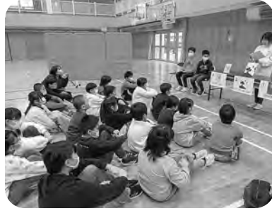
▲お勧めの本の紹介

12月13日、図書委員会がミニ集会を行いました。昨年に引き続き、図書委員が、低・中・高学年それぞれのグループに3冊ずつ本を紹介し、その中から読みたい「チャンプ本」を1冊、多数決で決めました。