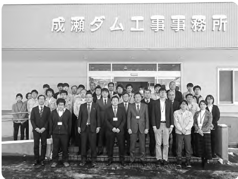
▲事務所職員一同 今年もよろしくお祈りいたします！

今年が皆様にとって幸多い年であることを祈念いたしまして、新年のご挨拶とさせていただきます。