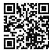
厚生労働省ホームページ

マイナンバーカードはこちらのポスターやステッカーを貼っている医療機関・薬局でご利用可能です！