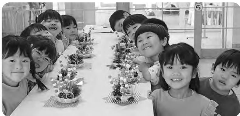
▲玄関に彩りを添えた5歳児のオリジナル松飾り

笑顔があふれ、歓声がこだまする保育園をめざし、今年も一生懸命努めて参ります。ご支援よろしくお願いたします。