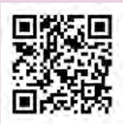
▲ふる里館 ホームページ