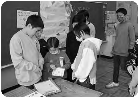
▲クイズの答え分かったぞ

縦割りグループで、学校に関する5つのクイズを協力して解き、正解を選んでいくと最後に「ふゆやすみ」という言葉になりました。下級生の子どもたちは「楽しかった。またやりたい。」と大喜びでした。