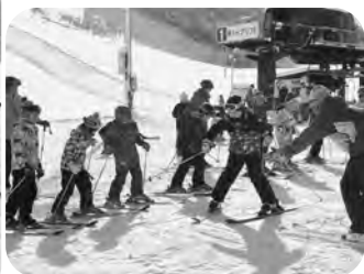
▲基本をしっかりと