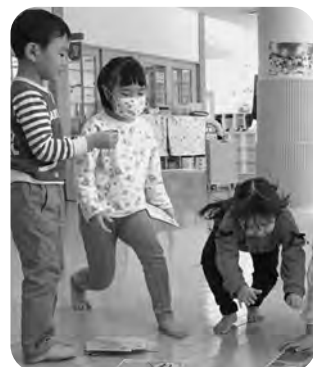
▲白熱する大型かるた