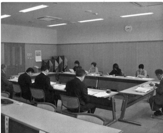
社会福祉法人なるせ保育会理事会の様子

法人の事務職員は現在の村臨時職員が退職して、法人職員として送迎バスの運転手と兼務で行う予定になっている。法人の事務所は、保育園のスペースの関係もあり、当面は教育委員会事務室で行うことになる予定である。 蛭川清水整備の 駐車場の確保を伺う 問 蛭川清水整備が今年計画されているが、道路に駐車して汲むため、危険な状況である。清水側は狭く反対側に広げて駐車場を造るなど後々に狭いなどと言われない駐車場が考えられないか伺う。 村長 蛭川清水周辺整備は、私も清水の反対側のり面に駐車帯ができないかと県へ打診したが、十八リットルのタンクを持って道路横断は交通安全上から大変危険であるとのこと、厳しい状況にあると思っている。そういうことから、清水側に「もしもしピット」をより長くとってもらい駐車場として利用できるよう今後検討していきたい。 問 滝ノ沢簡水は古く、石綿セメント管であり、消化栓もないので集落内工事を先行して早く給水ができないか伺う。 村長 滝ノ沢集落については優先して事業を進めたい。ただ、田子内に配水池を設置する関係で同時施工になる面もあるが、常に念頭において対応していきたいと思っている。 (文責は質問議員)