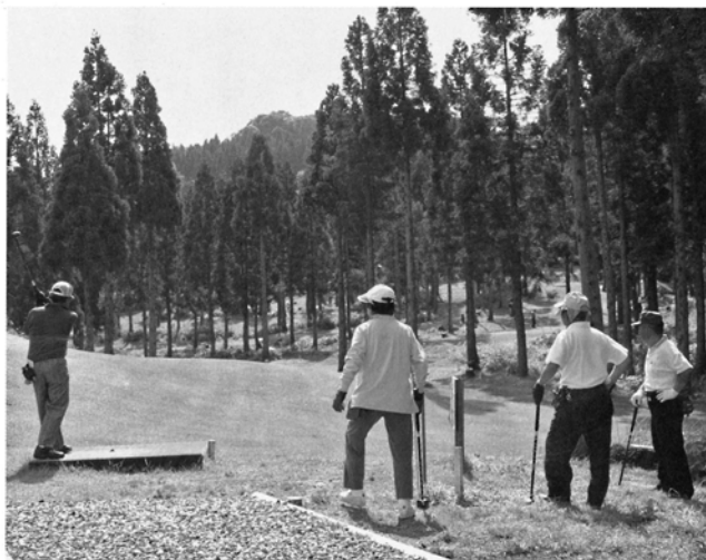
パークゴルフを楽しむ愛好者