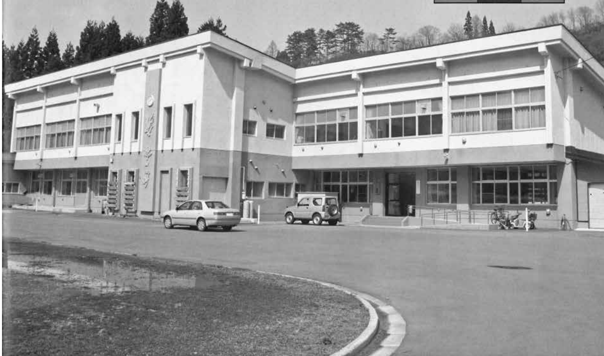
指定管理者が決まった「まるごと自然館」