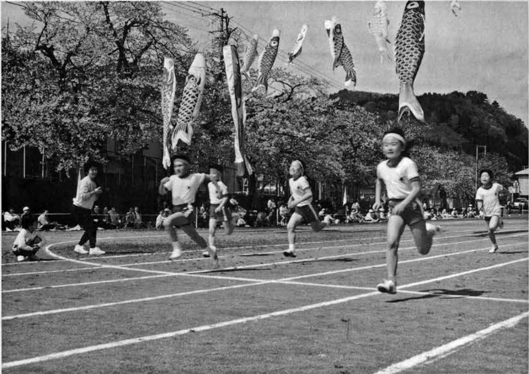
春本番を告げる運動会（田子内地区）