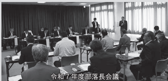
令和7年度部落長会議

地域の実情に詳しく、集落対策の推進に関してノウハウがある人材を配置し、集落の巡回・状況把握、話し合いの場の創出を行い、集落の維持・活性化を図る。既存の1名に加えて、新たに1名を新規採用予定。