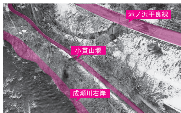
滝ノ沢平良線法面

答弁 昨年までの数字は控除を含んだもので、実態より少なかったことから、今年は県から提供された必要保険料を計上した。国保税を上げることなく予算確保できるものと考ええる。