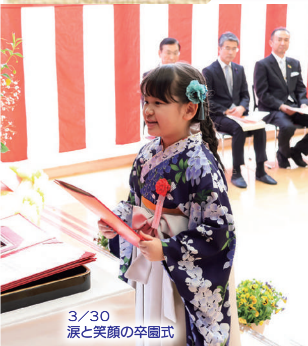
3/30 涙と笑顔の卒園式