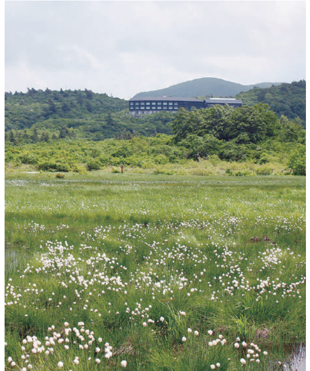
イワカガミ湿原より栗駒山荘を望む

村長 村としては事業者が設置主体の協議会が最適と考える。村が主体となれば、開発推進と受け取られかねなく、中立性の懸念がある。開発の可否など、着工までの各ステップで確認し、活発な議論のうえ結論を得ることが望ましい。