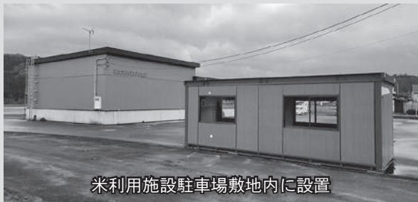
米利用施設駐車場敷地内に設置

廃棄物による環境への影響を低減させるため、資源リサイクルステーションを設置し、プラスチック容器包装類及び廃食用油等のリサイクルを促進。滝ノ沢地区に設置し、24時間持ち込み可能となる。