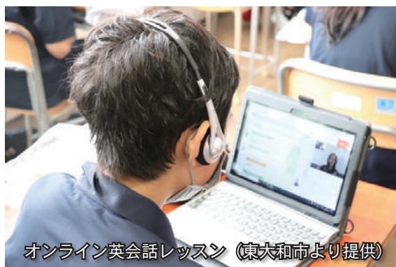
オンライン英会話レッスン (東大和市より提供)

教育長 現在、中学生の英語力は県平均を上回り、3年生の約50%が英検3級相当以上の力を有するなど成果が出ており、2名のALTによる生の英語教育を重視しているが、オンライン英会話も個別最適化された学習として有効であると認識しており、令和7年度からのデジタル教科書導入やICT環境の整備状況を鑑みながら、効果的な活用や支援の在り方を検討していく。