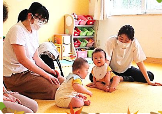
児童館休館日(日・祝)お休み