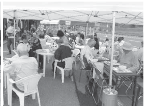
山菜まつり会場で昼食