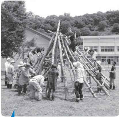
もうすぐ完成 〔7/8 竪穴式住居再現作業〕