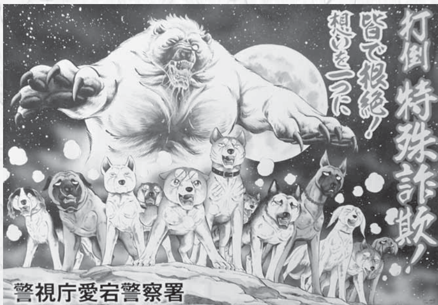
警視庁愛宕警察署