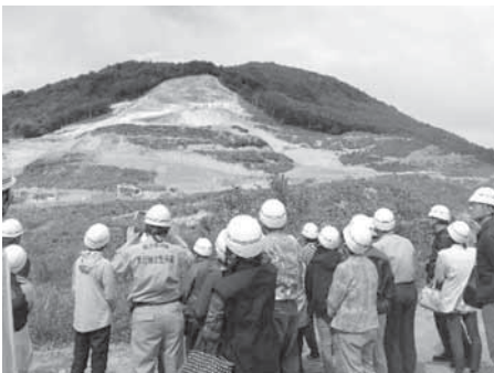
普段入れない場所から見学

当日は東成瀬村観光物産協会の協力を得て、「新緑山菜まつり」の会場で昼食を用意していただき、地場産品の買い物も楽しんでいただきました。