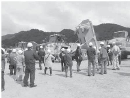
間近で見る重ダンプ