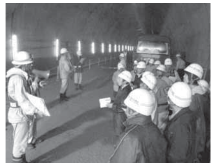
昨年の村民対象見学会(41名参加)

詳細につきましては、成瀬ダム工事事務所ホームページ等でお知らせします。 成瀬ダム で検索