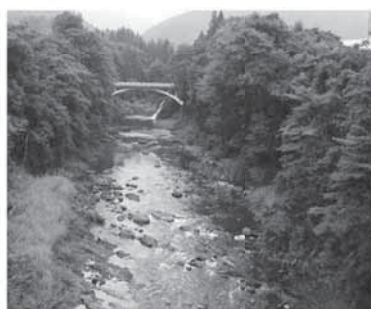
小雨時(渇水時) (田子内橋:H24.9.6)

成瀬ダムの貯水池に蓄えられる水は約7,850万 m^3 で、この内、2,650万 m^3 が「流水の正常な機能の維持」のために使われます。 「流水の正常な機能の維持」とは、魚類の生息環境や漁業、景観、水質の維持、既得用水※への補給のための水であり、成瀬川から取水されている村内の農業用水も既得用水に含まれます。 ダムができると、小雨時でも川が涸れることがなくなり、常に一定量の水が流れ、村内の水田に農業用水を補給できるようになります。