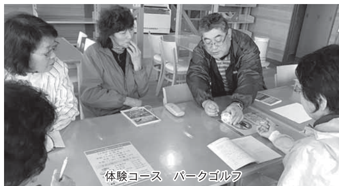
体験コース パークゴルフ