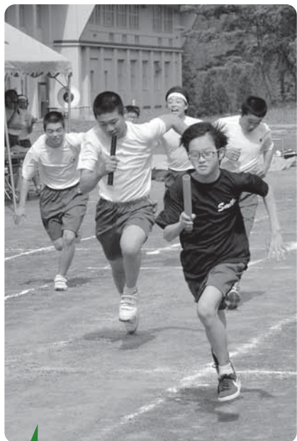
大接戦！ 〔5/25 中学校体育祭〕