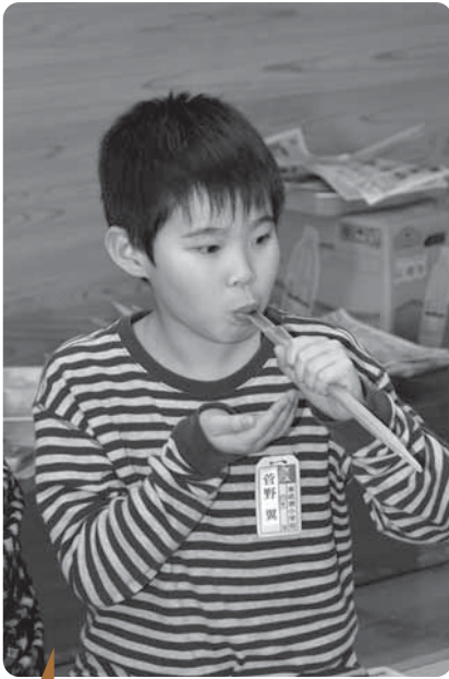
うめがったあ [12/16 豆腐あぶり]