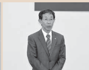
11/5 中学校創立70周年・統合40周年記念事業 11/28 民生児童委員辞令交付式