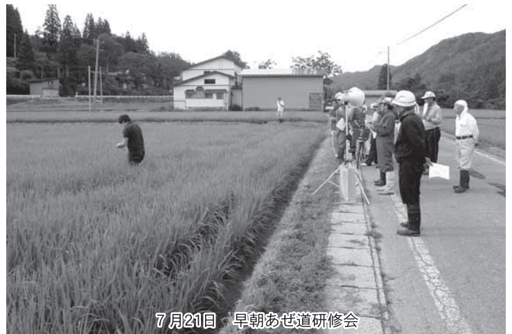
7月21日 早朝あぜ道研修会