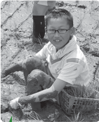
泥んこ田植 〔5/31 小学校田植〕