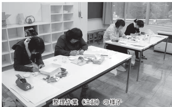
整理作業(注記)の様子