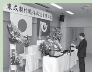
5 / 10 戦傷病没者追悼式