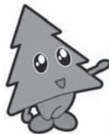
秋田県 マスコット スギツチ

男だから、女だからではなく、みんなが力を出し合い、あらゆる分野で活躍できる環境をつくるのが大切なんだ。自分に何ができるかは、性別で決まることではなく、個性や能力に合わせて決めることだよ。