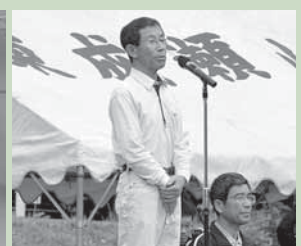
5 / 21 小学校運動会