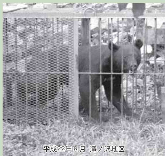
平成22年8月 滝ノ沢地区