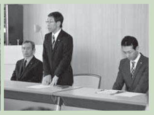
4 / 6 村立小中学校転入者合同挨拶会