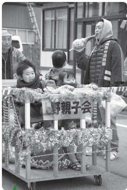
上野親子会 〔5/10 岩井川お祭り〕