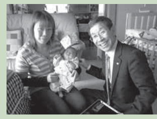
4 / 3 出生祝い金支給