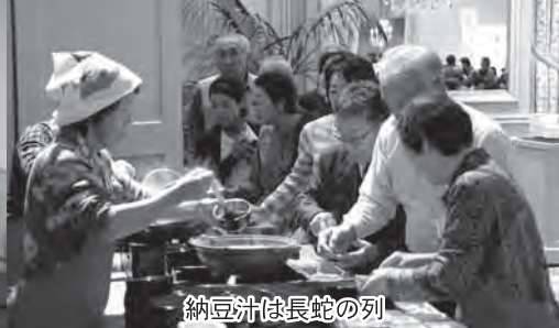
納豆汁は長蛇の列