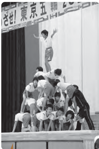
ヨッ!お見事! 〔10/19 小学校学習発表会〕