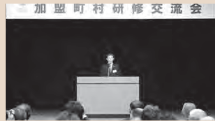
10/19日美連東北ブロック会議