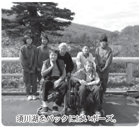
須川湖をバックにはいポーズ。

9月より東成瀬中学校生徒さんによる幸寿苑ボランティア活動が始まっておりほぼ毎週土曜日の10時から15時まで、入所者さんのお世話をさせていただいております。食事介助や苑内清掃を頑張っておりますが、写真は散歩の付き添いとドライブの付き添いでのごひとこまでです。