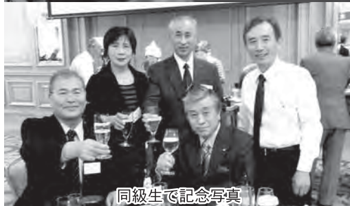
同級生で記念写真