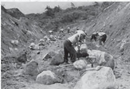
【須川温泉入口・道路工事】

その当時は、地名「天竺」までは営林署のトラック（木炭車）が走っていた。国有林の灌木の伐採、植林等に、椿台、五里台やその先の部落の多くの人達が働きに出ていたようである。現在、ダム予定地となっている「仁郷」には営林署の宿舎があり分教場もあった。その天竺から須川までは車（くるま）みちがなく、湯治客はこの天竺から歩いたものだった。