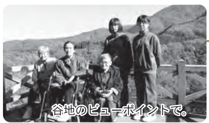
谷地のビューポイントで。