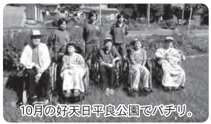
10月の好天日平良公園でパチリ。