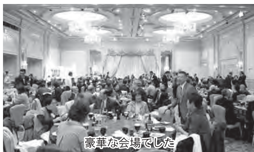
豪華な会場でした

首都圏なるせ会は、平成元年に発足して以来25年間、首都圏在住の村出身者とふるさと東成瀬村とをつなぐ機関として大事な役割を担ってきました。総会には会員及び村民合わせて219名が出席し、納豆汁等ふるさとの味を堪能しながら、懐かしい友との再会で会話がはずみ、会場いっぱいに笑顔が広がっていました。