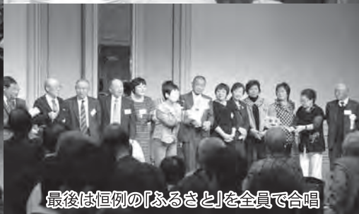
最後は恒例の「ふるさと」を全員で合唱