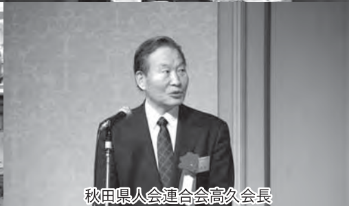
秋田県人会連合会高久会長