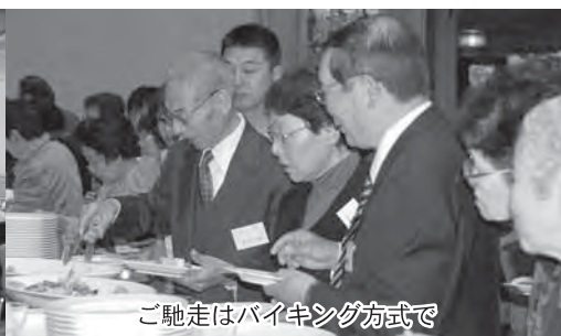
ご馳走はバイキング方式