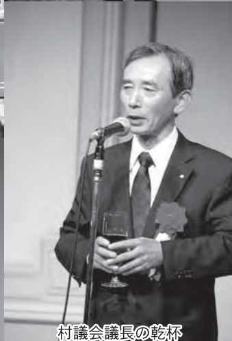
村議会議長の乾杯