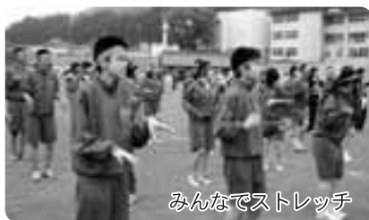
みんなでストレッチ