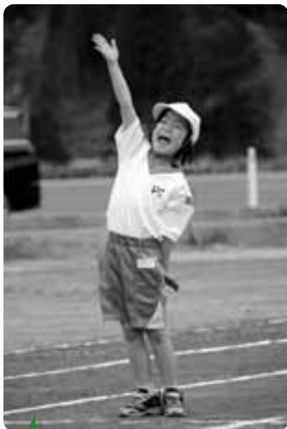
元気いっぱい！ 〔5/19 小学校運動会〕