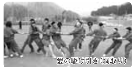
愛の駆け引き(綱取り)