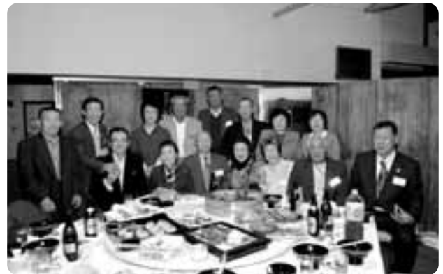
交流会にて記念写真