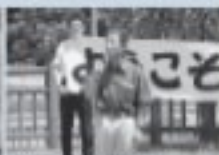
6/30 復興支那歓迎セレモニー