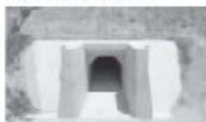
上段トンネル完成(谷口側)