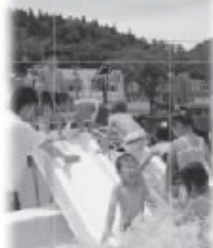
ボール遊び（左）になる（保育園）