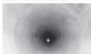
上段トンネル完成(トンネル内側)