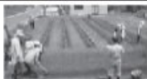
共同で花植えを行う五里台集落協定