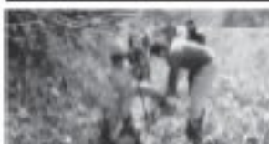
糖の田あげ作業に取り組む入道集落協定