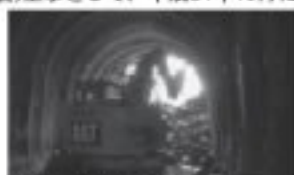
上段トンネル貫通時の状況