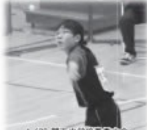
4/29 新市中学校春季大会