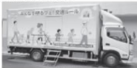
まもるくとあいちゃん号

今回体験したことを忘れずに、登下校時や外で遊ぶときなど、交通ルールを守って事故にあわないように注意しましょう。