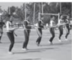
■ウェットスーツに身を包んで、「ハイサイおじさん」の曲に合わせて準備運動です……。