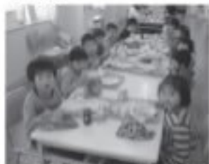
上の写真は、1年生初めての

新学期がスタートして、約1ヶ月が過ぎ、子どもたちは、新しい学年に慣れ、元気に生活しています。