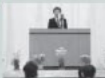
4/5 東成瀬小学校入学式