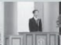
4/5 東成瀬中学校入学式