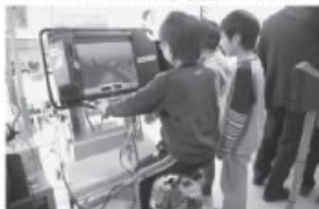
自転車シミュレーション