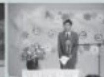
4/5 なるせ保育園入園式