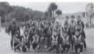
■マリン体験(シュノーケリング)

徒もいましたが、みんな心をひとつにして行動してきました。本当に意義ある沖縄の旅でした。その一部を写真で紹介します。