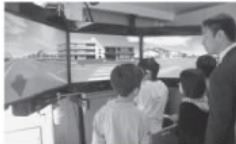
歩行シミュレーション