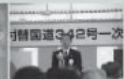
4/27 成瀬ダム情報センター防災情報センター