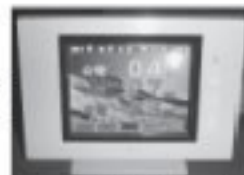
太陽光発電モニター