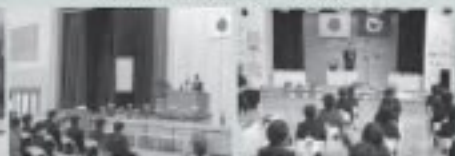
3/16 東成瀬小学校卒業式 3/22 なるせ保育園卒園式