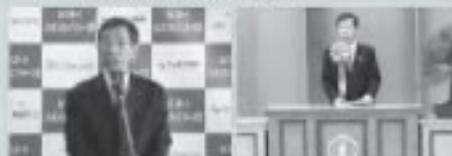
3/3 ジュネスカップスキー大会 3/7 東成瀬中学校卒業式