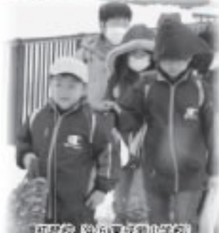
小学校 第6回東成瀬小学校