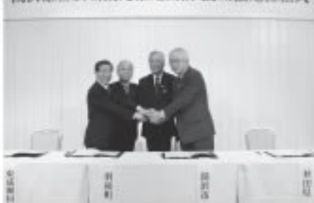
湯沢雄勝広域観光推進機構 設立協定締結式

今回の『湯沢雄勝広域観光推進機構』は、市郡では初めての連携組織となり、今年度から仙台圏を中心とした観光客の入込を増やすため、様々な事業を実施する予定です。