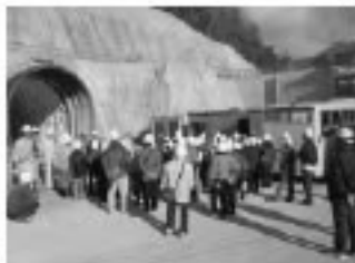
■現場見学会の様子