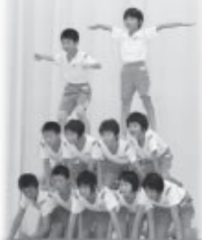
10月16日(日)豊小学児童会