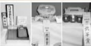
あきたこまち 平良カブ熟漬け フルティカドルチェ