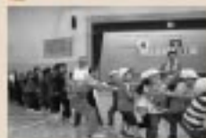
10/1 なるせ保育園ちびっ子運動会