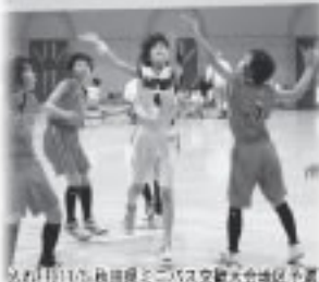
10月17日(木)秋田県こども文化大会地区予選