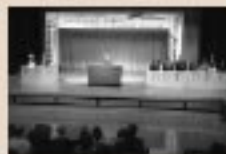
10/14 とうほく街道会議