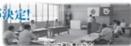
岩井川選任委員会写真