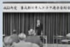
6/2 老人クラブ連合会総会