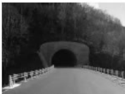
■1号トンネル 起点側入口