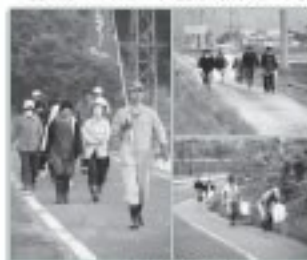
ウォーキング・ゴミ拾い