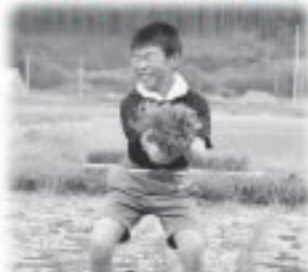
フェイスブックの子猫(5/20)と小5年田植え