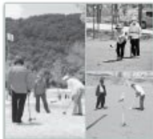
パークゴルフ・グラウンドゴルフ