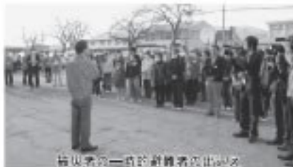
被災者の一時的避難者の出発式