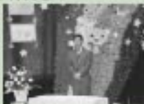
3/23 こばと保育園卒・別園式