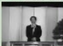
3/11 東成瀬中学校卒業式