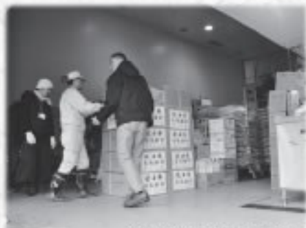
3/16 陸前高田市に運ばれた物資の検閲作業と被災の様子