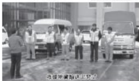
救援物資積込作業