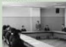
3/29 転出教職員合同授与式