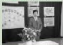
3/23 やまゆり保育園卒・別園式