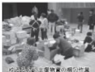
ゆるぎない支援物資の梱包作業