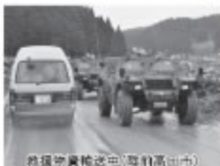
救援物資輸送中(野田高田市)