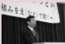
1/30 農業を語るつどい