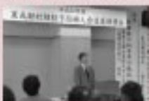
1/25 村給食子供園会研修会