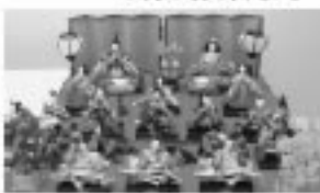
☎ ふる里館 ☎47-2241