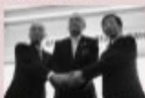
1/17 定住自立圏形成協定調印式