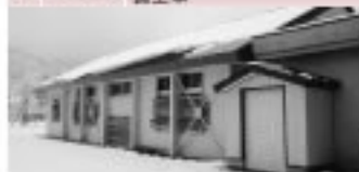
まるごと自然館 屋内運動場