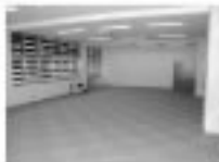
観光案内スペース

なお、成瀬川交流館は、これから少しずつ展示資料等を準備していき、今年4月の開館に向けて準備を進めていくこととなります。