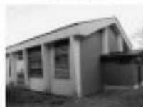
イベント館(旧体育館)