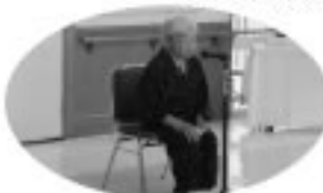
ふくはうち・すずめの仇討ち

そういえば小さい頃、囲炉裏端で聞いた事があるような懐かしい音語。語にどんど ん引き込まれていきました。あちらこちらから思わず笑い声が。中には涙をうかべる 入居者もいました。昔を懐かしんだひとときでした。