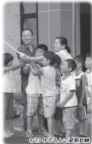
2010年8月26日 町内清掃活動