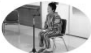
ねずみの餅つき・三枚のおふだ