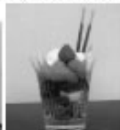
↑こんなパフェです