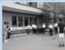
8/4 反映平和の火リレー