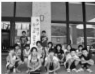
■東小6年生スタッフ一同

～6年生がスタッフとしてがんばりました～ ゆるるんを会場に児童劇団回事業（千葉県ばび ぶべ劇場）の公演が行われ約 150名（保育園 児・学童・おじ いさんおばあさん）が見に来て くれました。