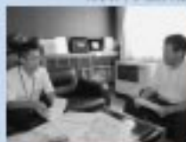
8/6 東成瀬中学校生徒と対談