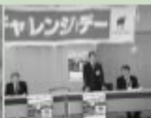
4/14 チャレンジデー実行委員会