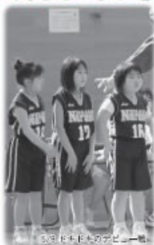
5月18日土曜日のデビュー戦。