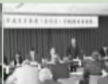
4/23 専務長・行政協力員会議