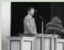
4/6 東成瀬中学校入学式