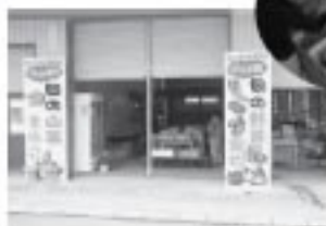
滝ノ沢物産販売所