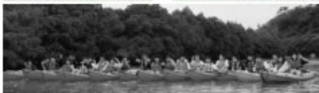
■東村のマングローブの中で全員が手をつなぎ横一列になった瞬間