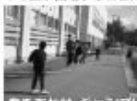
競をあわせ、ジャンプ!

この大会は、10名以上のまだちが一層に遊ぶ大なわとびの大会です。今回、県体育協会から推薦を受け、6年生が出場することになりました。