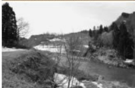
■谷地地区の河川改修要望