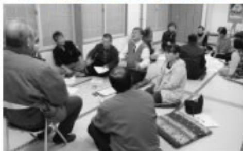
■大柳地区での座談会の様子

この座談会の内容もふまえて、研究がすすめられ、2月にはフォーラムも予定されています。フォーラムでは、昨年実施したアンケート調査結果や、座談会の内容も紹介する予定です。みなさんの参加をお待ちしております。