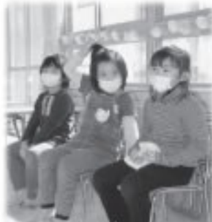
ここは、みなさんが主人公になるコーナーです。情報お持ちしあげましょー！