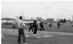
■郡支部消防訓練大会

8月26日(水)は、田子内地区を中心に「湯沢市雄勝郡総合防災訓練」が実施されます。住民の皆さんのご協力をお願いします。