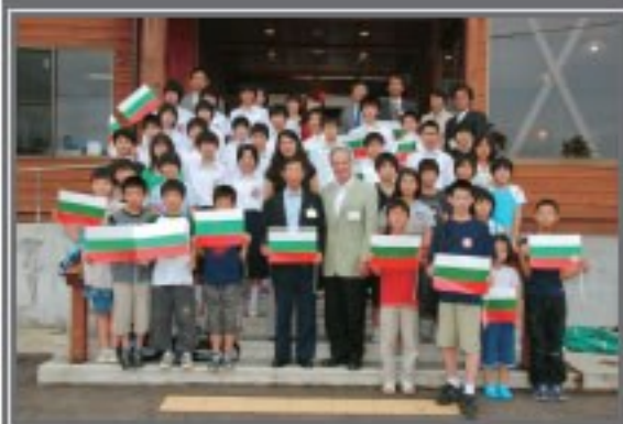
センドフ大使と記念写真