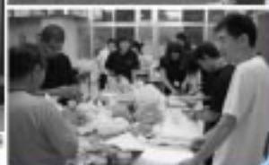
宮城県からの夢在5期生 名譽個人第20期誕生!