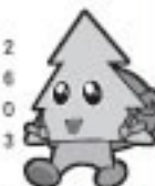
雄勝マスコットユダヤ