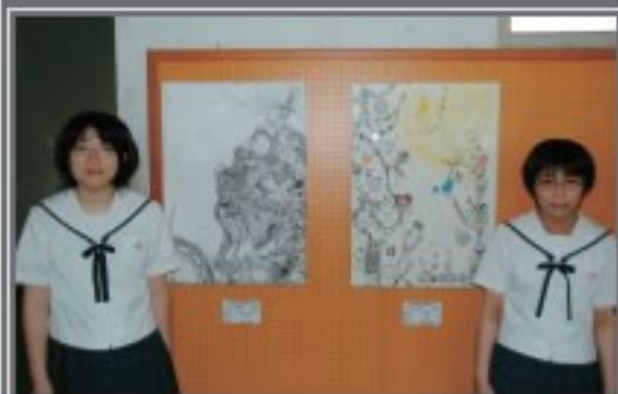
県展 奨励賞作品(デザイン部門)