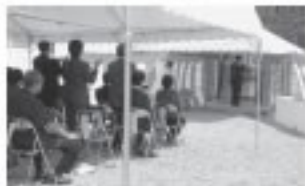
■6/25 工事の安全を願い起工式が行われた。