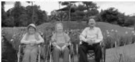
口あやめ見学 浅舞公園に出かけました。梅雨の晴れ見事な花びらをつけ、私たちを迎えてくれました。子どももおもしろかった。