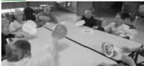
口銭船卓球 風船とうちわを使ってる卓球、劇や習字等、身体を思いっきり動かしました。