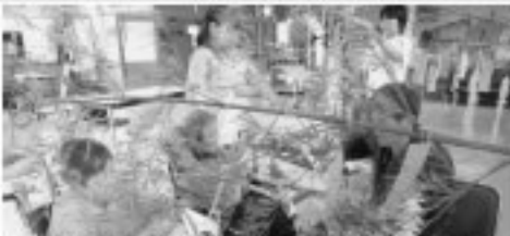
口七夕祭り 東中生の皆さんに手伝っていただきながら、飾り付けを行いました。願いが叶いますように。