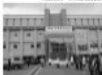
6/18 反戦・平和リレー