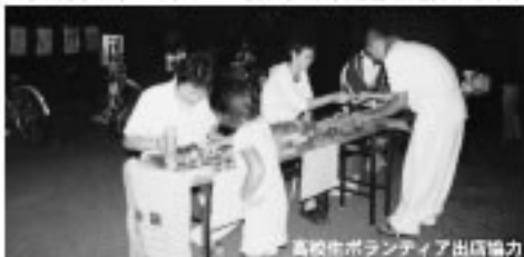
高校生ボランティア出店協力