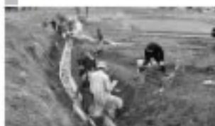
■五里台：村の農業用水路等改修資材現物支給制度を活用してのU字溝設置作業