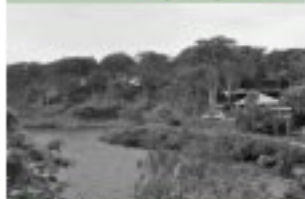
□ 須川湖キャンプ場