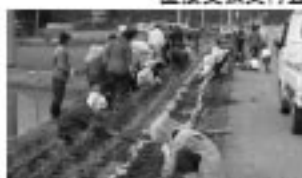
■下田：非農家との連携のもと行われている、農産作物の作付活動