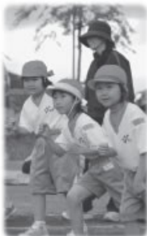
ここは、みなさんが主人公になるコーナーです。 情報お待ちしていますっ！