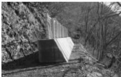
村道交通安全対策工事 (擁壁19m、防護柵18m) (不動沢)