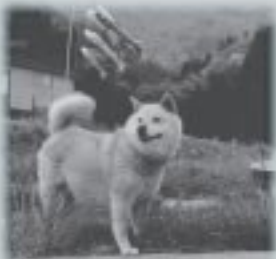
※写真と本文は関係ありません