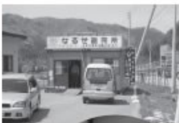
■滝ノ沢物産販売所