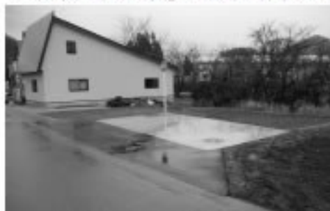
防火水槽新設工事 (40m 2 : 1基) (滝ノ沢)

次の工事は、平成20年度電源立地地域対策交付金を活用して、滝ノ沢地区に整備されました。