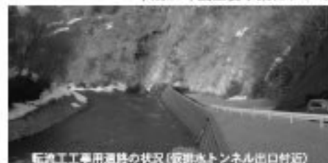
転流工事用道路の状況(飯掛池トンネル出口付近)