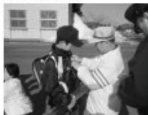
■平成21年度職員一覧

子どもたちはもちろんですが、ご家庭や地域でも十分に交通安全に気をつけてください。