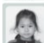
石 鏡 優 月 (田子内) ドーナツ屋さん