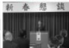
1/16 農工会新春懇談会