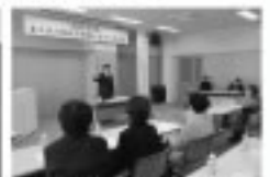
1/28 総核子防備人会役員研修会