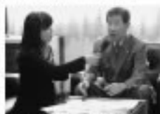
1/5 F知埠一とびあ取村