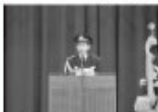
1/4 東成瀬村消防団出初式