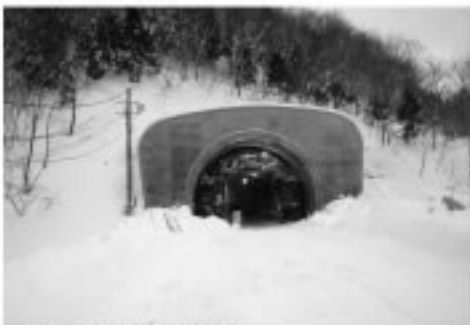
■1号トンネル：坑門工（起点側）

A. 1号橋については、1月までで橋脚3基、橋台2基からなる下部工が完成しています。