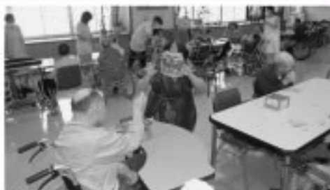
■厨分：先は一外、福は一内！ 鬼に向かって豆をまき1年の無病息災を願いました。

□1月は色々なゲームを楽しみました。大・小の輪を投げ入れ点数を競い紅白に分かれて玉入れ競争。開始早々勝利のVサインもー。