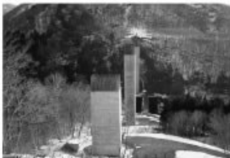
■1号橋：完成した3基の橋脚

これら2工事とも、長い工期の末、無事に完成を迎えることとなります。ご協力ありがとうございました。