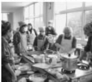
■熱心に調理に取り組む2年生の皆さん

いませんが、子どもたち一人一人の顔が込められた12本の素敵なクリスマスツリーが完成しました。