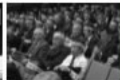
11/25 全国過疎地域自立促進連携定例会