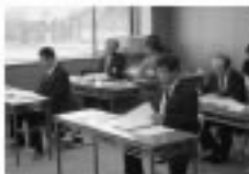
11/7 湯沢越前広域市町村圏組合臨時議会