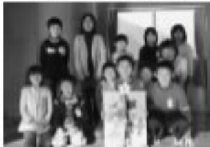
＜ふれあい班で飾り付け＞