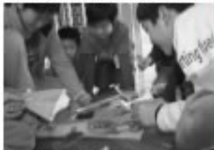
＜ふれあい班で飾り付け＞

いませんが、子どもたち一人一人の顔が込められた12本の素敵なクリスマスツリーが完成しました。