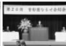
11/16 第20回首首懸なるせ会総会