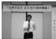
11/8 男女共同参画基礎講座